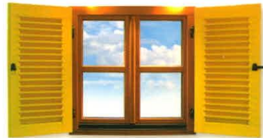
▶ Außen Lamellenfensterläden