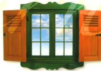
▶ Außen Fensterläden Kombination Lamellen und Füllungsläden

Holzfensterläden von FERNO werden aus Kieferholz oder Mahagoni Meranti hergestellt. Sie sind imprägniert und mit Acrylfarben gestrichen. Im Angebot von FERNO befinden sich sowohl Außen-Lamellenfensterläden, als auch Innen-Füllungsläden.