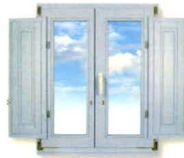
▶ Innen Füllungsläden