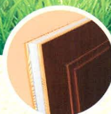
mart, hőszigetelt bejárati ajtóbetét