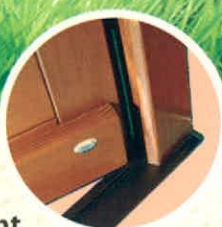
bejárati ajtó alsó küszöb kiképzés