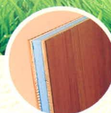
marás nélküli hőszigetelt bejárati ajtóbetét