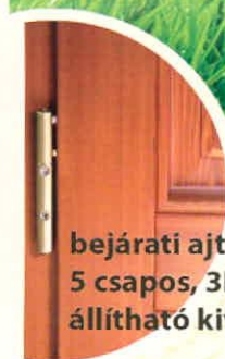
bejárati ajtópánt 5 csapos, 3D pánt állítható kivitel